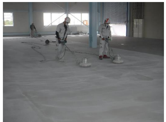
⑫ポリッシャーによる補修