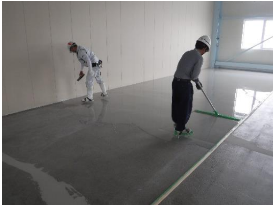
⑨トンボ・コテ均し