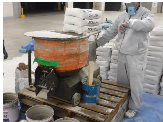
⑥練混ぜ（グラウトミキサー）