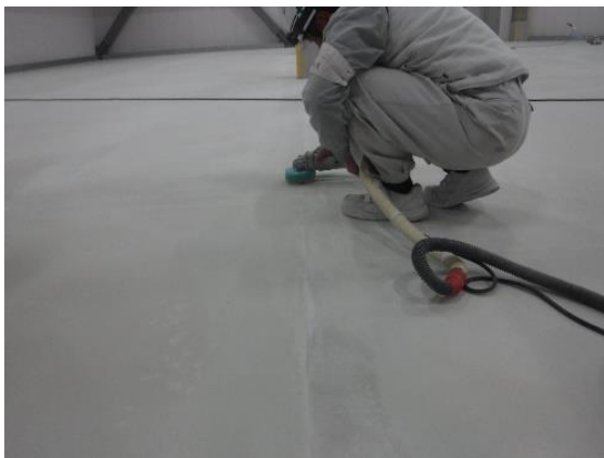
⑪打ち継ぎ部分補修