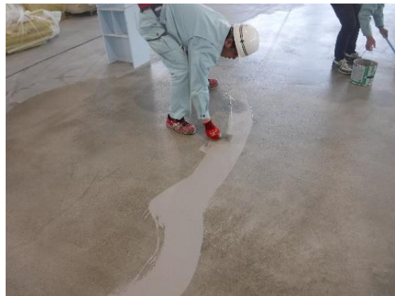
②クラック・不陸などの補修