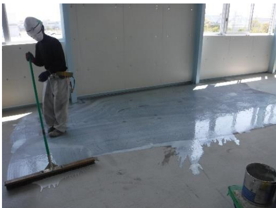
③吸水調整材の塗布 1