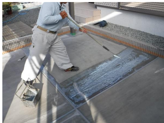
④吸水調整材の塗布 2