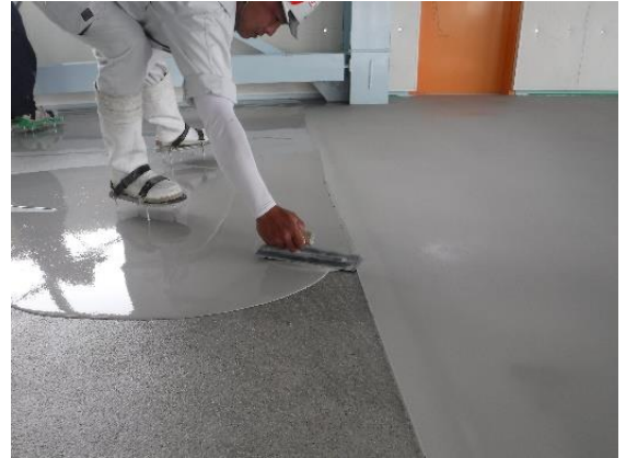
⑩コテ均し（打ち継ぎ部分）