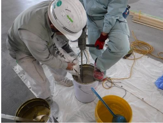
⑦練混ぜ（ハンドミキサー）